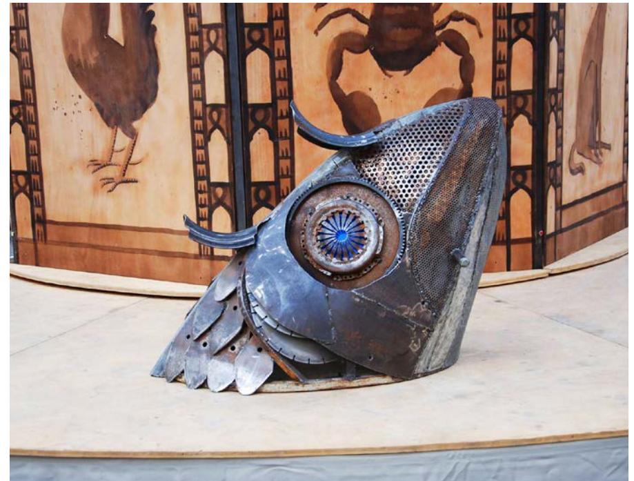
Le Manège des 1001 nuits, une création 2013